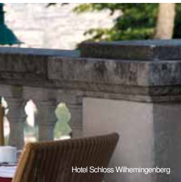
Hotel Schloss Wilhemingenberg