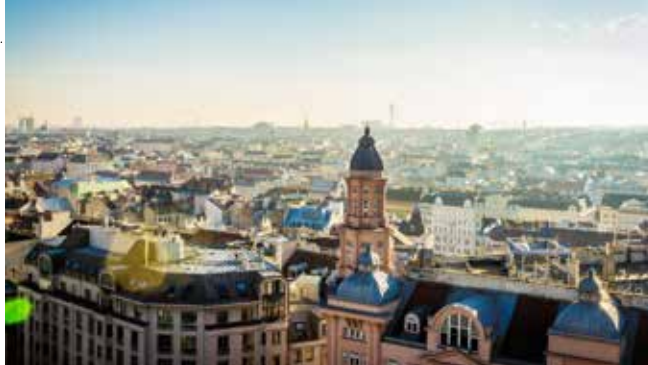
BLICK VOM HAUS DES MEERES