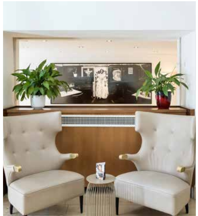
Rathaus Town hall

Explore the places of historical interest in the vicinity of our hotel under your own steam with the individual audio guide, ‘Hearonymus’, which you can easily download on your smartphone. Listening to descriptions of unique city walks allows you to immerse yourself in the quintessential Vienna. Browse through our bookshop with its lovingly selected range focusing on Vienna, and relax with something interesting to read in our ‘Platzl’ – a lounge